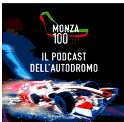
La copertina del podcast